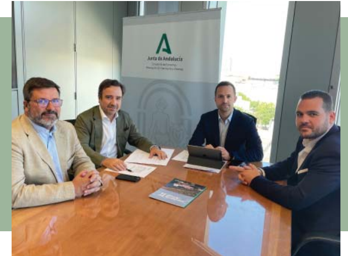
Reunión con el nuevo Director General de Infraestructuras Viarias.