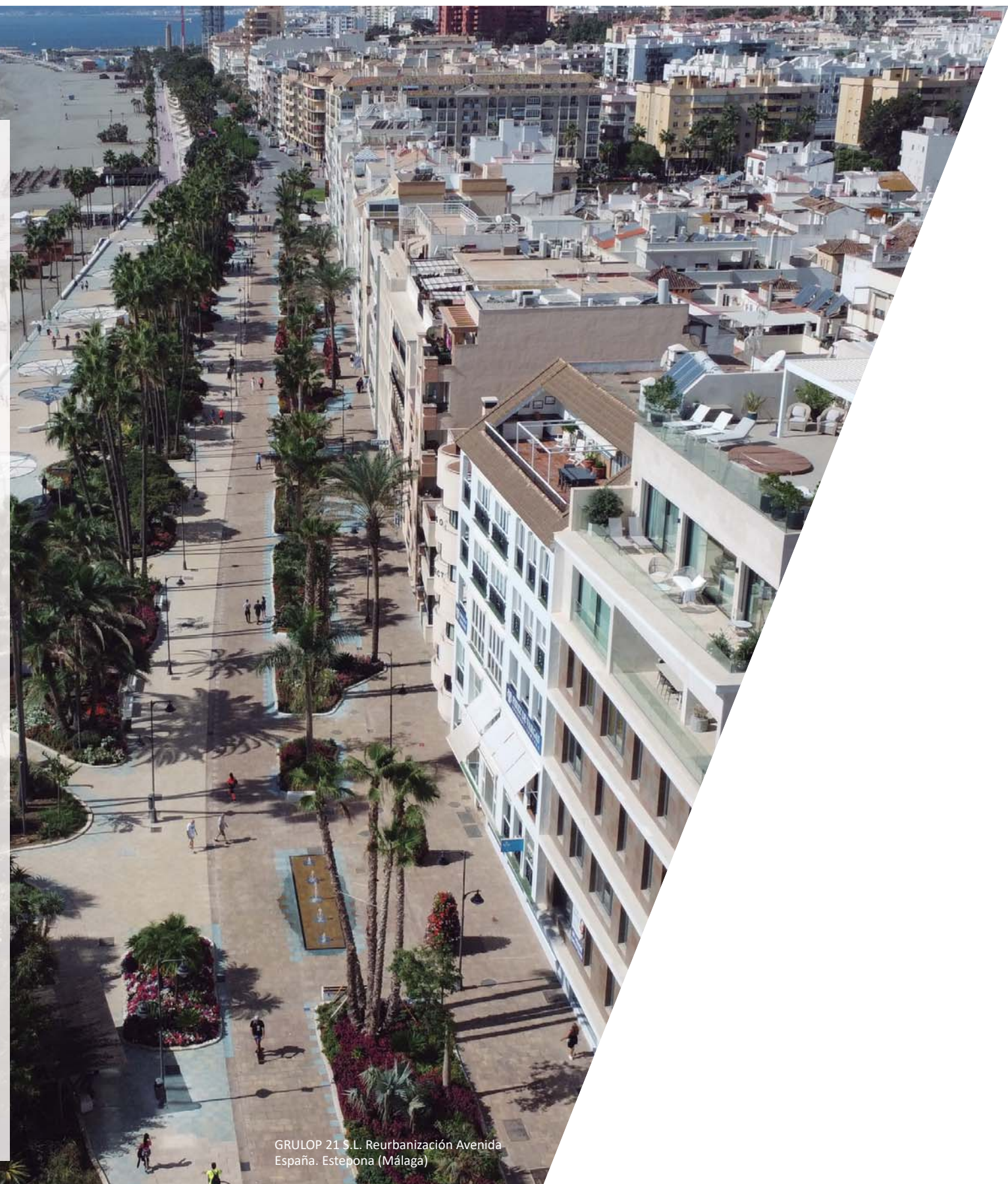
GRULOP 21 S.L. Reurbanización Avenida España. Estepona (Málaga)

Esta circunstancia, negativa para el sector constructor en general, es especialmente preocupante en el caso de las compañías pequeñas y medianas, cuya actividad está muy ligada a la contratación municipal y cuya escasa capacidad para soportar las pérdidas que acarrear los sobrecostes está poniendo en serio riesgo su futuro y el de sus trabajadores.