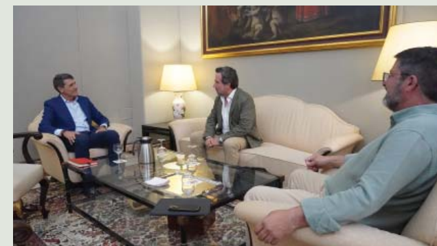
Reunión con el Delegado del Gobierno en Andalucía.

Hemos mantenido un encuentro con el delegado del Gobierno de España en Andalucía, Pedro Fernández, con quien hemos compartido un análisis del estado en el que se encuentra sector de la ingeniería y la construcción, las principales preocupaciones y retos a los que se enfrenta y cómo les afectan los fondos europeos 'Next Generation EU'.