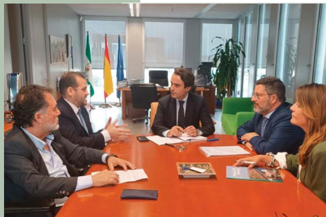
Reunión con el Viceconsejero de Fomento, Articulación del Territorio y Vivienda.

En la agenda de CEACOP están las reuniones periódicas con el viceconsejero de Fomento, Articulación del Territorio y Vivienda, en las cuales se toma el pulso al sector. Una de las prioridades es reivindicar el aumento de inversión en obra pública, así como la importancia de que cada vez sea mayor el porcentaje de adjudicaciones a empresas locales. Otro de los asuntos ha sido obtener una previsión de las licitaciones del año en curso con objeto de que las empresas puedan planificar sus trabajos de estudio de proyectos y concurrir a ellos.