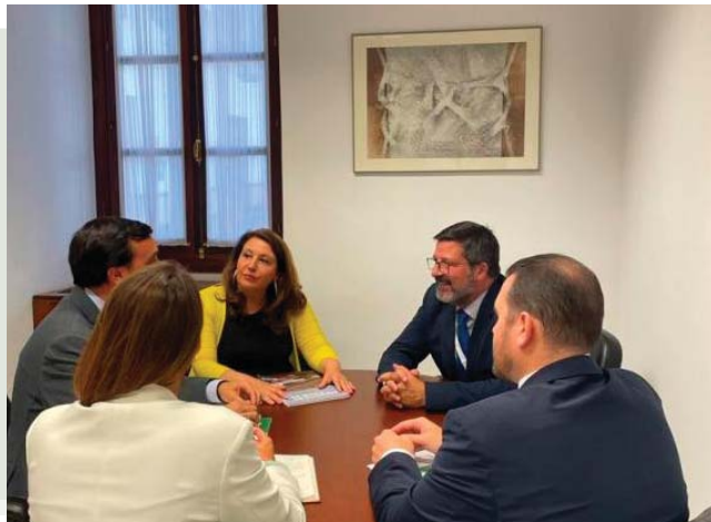
Reunión con la Consejera de Agricultura, Pesca, Agua y Desarrollo Rural, y el Director General de Infraestructuras del Agua.

En la reunión con la Consejera de Agricultura, Carmen Crespo y el D.G. de Infraestructuras del Agua, Álvaro Real se puso sobre la mesa los retrasos en las licitaciones y adjudicaciones, la revisión de precios de los contratos y el Plan de Inversiones en Depuración. Nos han trasladado su intención de recuperar el Canon del Agua en 2024, y que de esta recaudación saldrá la parte provisional a la revisión de precios, que se han comprometido a tramitar ágilmente.