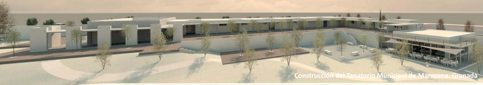
Construcción del Tanatorio Municipal de Maracena. Granada

como Colombia, México, Rumania y Armenia entre otros. Todos los esfuerzos de Grulop 21 se centran en convertirse en una constructora de referencia dentro y fuera de Andalucía.