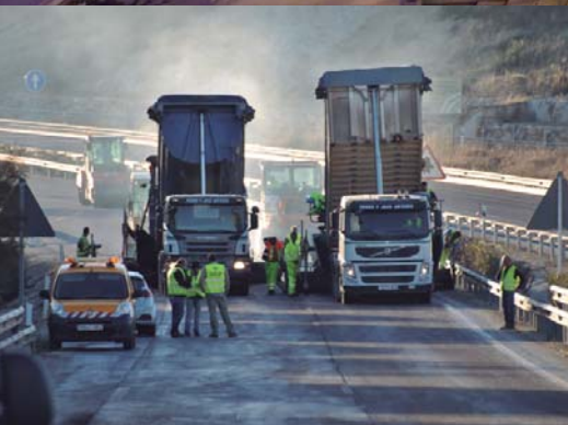
Remodelación de seguridad vial en tramo de concentración de accidentes en la autovía A-316 del P.K. 76+000 al P.K. 82+300. Jaén