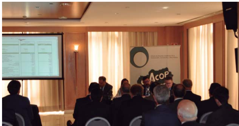
Asistentes Asamblea CEACOP

En el mes de Marzo CEACOP celebraba su Asamblea General Ordinaria. En esta importante cita anual se hizo balance de las actividades e iniciativas llevadas a cabo por la asociación a lo largo del año 2018 en defensa de los intereses de las empresas asociadas, y del sector de la construcción y la consultoría en general. Asimismo, se establecieron las nuevas líneas de actuación de cara al presente ejercicio.