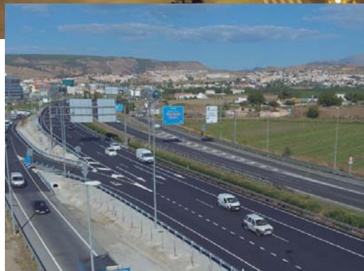
Mejora de la seguridad vial en la calzada izquierda de la Autovía A-395, entre los P.P.K.K. 0+000 y 0+800. Granada