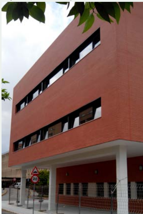
▲ Aulario de la Universidad de Sevilla en el Hospital Universitario Virgen del Rocío (Sevilla)

Heredera de la componente pública de la Ingeniería Civil, ha centralizado sus trabajos en la construcción de todo tipo de equipamientos públicos y el diseño de espacios urbanos. Proyectamos espacios como estructuras abiertas al usuario y funcionalmente flexibles, no como objetos acabados y cerrados.