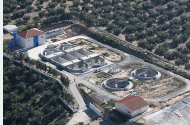
▲ Agrupación de vertidos y EDAR de la aglomeración urbana de Mancha Real (Jaén)