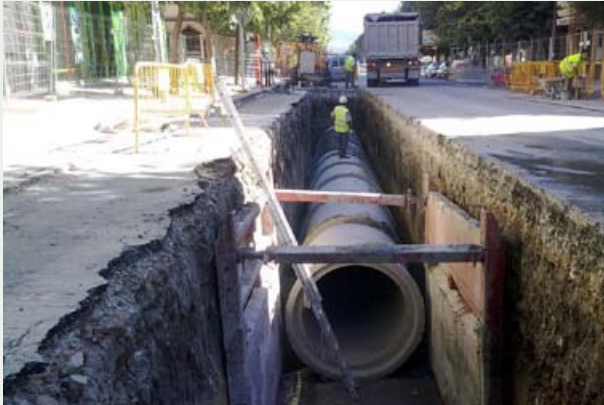
▲ Obras y control de inundaciones en el núcleo urbano de Alcalá la Real (Jaén)

conseguir que nuestras Instalaciones de Abastecimiento, Saneamiento y Depuración sean más eficientes, basando en el compromiso con el desarrollo de soluciones sostenibles.