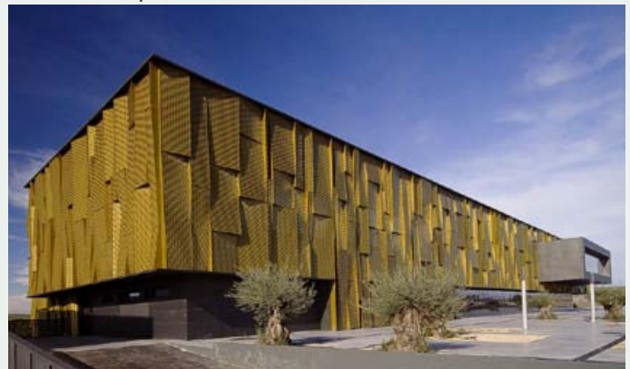
▲ Project Management del Museo del Aceite de Oliva en Geolit (Mengíbar, Jaén)

Provee servicios de consultoría y gestión integral de proyectos de construcción para cualquier sector inversor o de promoción que pretenda alcanzar los objetivos de éxito fijados en sus proyectos. Rentabilizar al máximo las inversiones no solo consiste en optimizar los recursos y analizar las soluciones más viables, controlando costes y plazos y responder por la calidad convenida, en la actualidad es fundamental la gestión de los interesados y la evaluación de riesgos para evitar que los proyectos sufran grandes impactos.