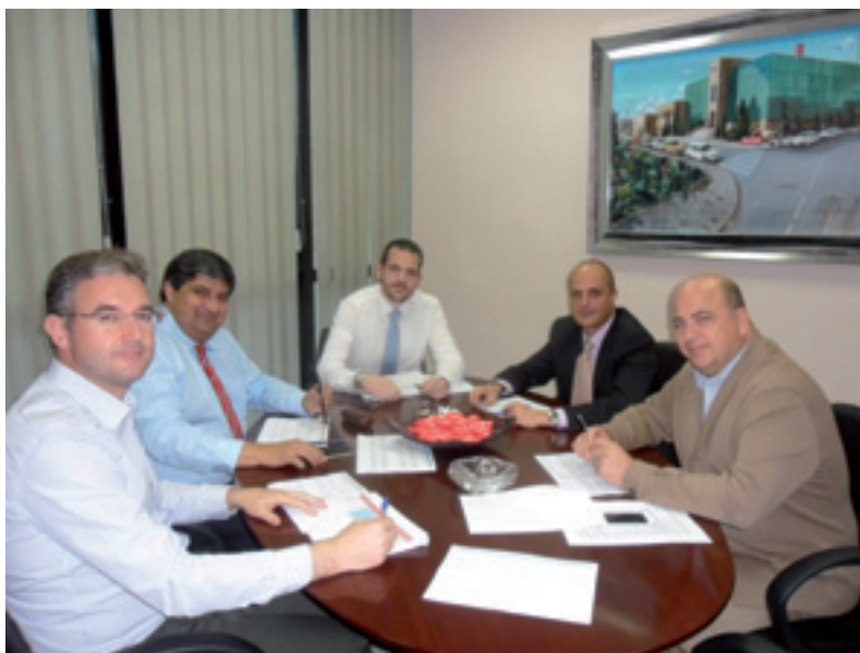
▲ Comité de Dirección de UCOP Construcciones

La empresa ejecuta algunas de las obras más importantes de Granada, es el caso del Metro, Ucop participa en los contratos para la ejecución de los