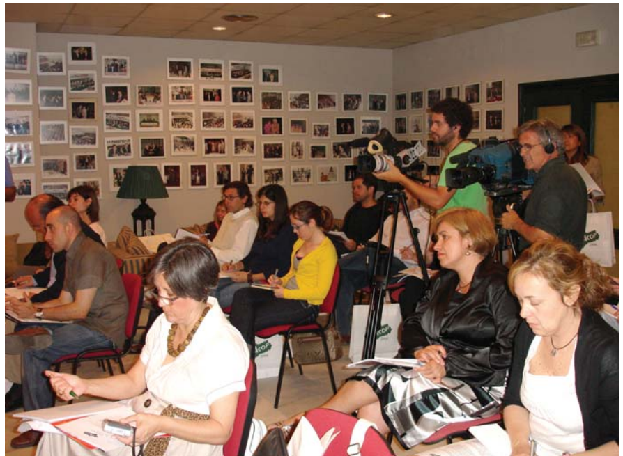
Medios de comunicación asistentes a la rueda de prensa de Ceacop.