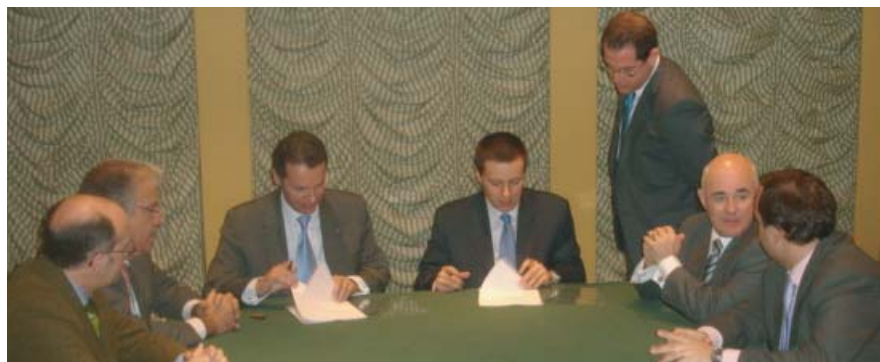
Imagen del convenio de Ceacop con Caixa Catalunya.