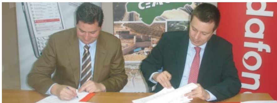
Momento de la firma del convenio con Vodafone.