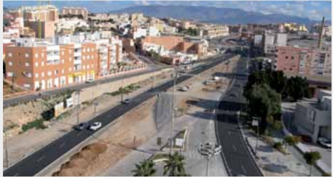
◆ Desdoblamiento de la N-340 en la entrada norte de Almería