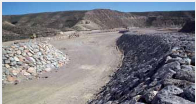
▲ Encauzamiento Rambla en el PITA