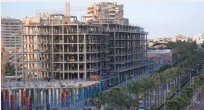
▲ Edificios y viviendas Aguadulce