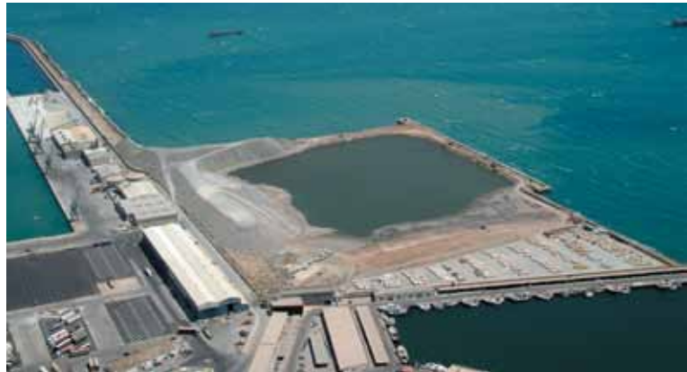
▲ Ampliación del dique de Poniente del Puerto de Almería

La solvencia técnica con la que se aborda cada actuación supone cuidar hasta el más