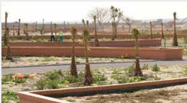
▲ Parque Periurbano del Andarax