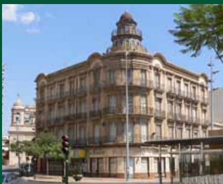
▲ Rehabilitación Edificio Las Mariposas (Almería)

Construcciones Tejera es una firma andaluza dedicada al área de la construcción especializada en obras públicas y privadas cuyos inicios se remontan a principios de los años 60. Sin embargo tal y como hoy la conocemos se fundó en 1984 con capital 100% almeriense.