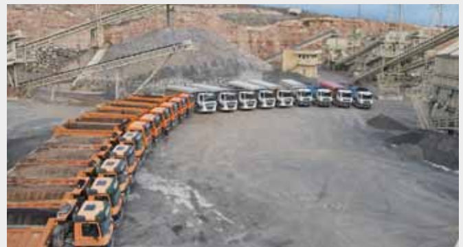
▲ Extracción de 1.500.000 m 3 de tierra para la construcción de la infraestructura ferroviaria para el AVE