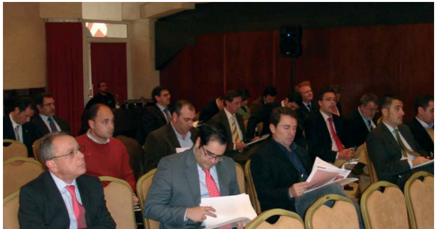
Asociados asistentes al acto.

Asimismo en la Asamblea General, los empresarios asistentes al acto reconocieron la dificultad ofrecida por la Administración pública para crear una empresa, así lo expuso el presidente "la Administración está poniendo demasiadas trabas para la formalización e iniciación de un proyecto empresarial, por ello, exigimos mayor fluidez y rapidez para realizar los trámites a la hora de crear una empresa y que no se obstaculice más de lo que ya se está haciendo".