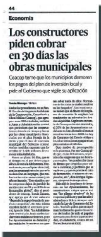
Diario de Sevilla