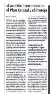
El Correo de Andalucía