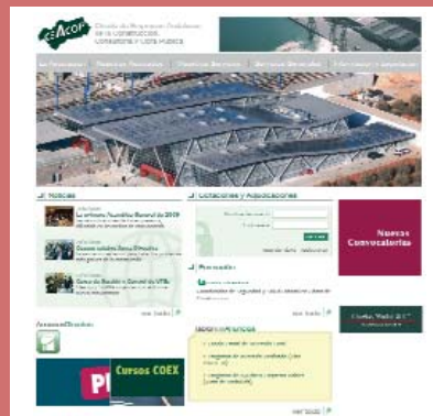
Portal de Ceacop.